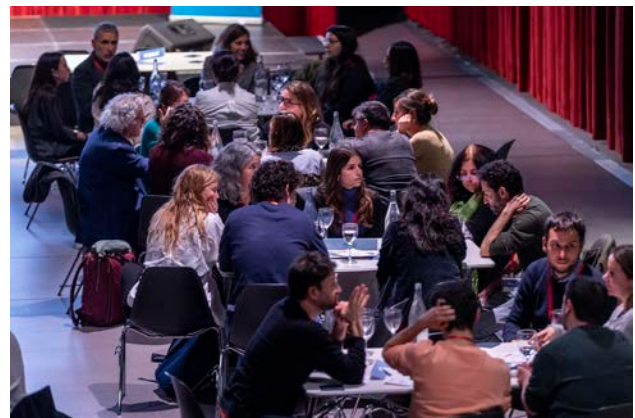
Dinàmica de les persones assistents

A continuació, es va explorar quines preguntes d'avaluació es podrien resoldre: Les beques menjador són efectives per millorar rendiment escolar i salut? Quin impacte tindria l'extensió de la gratuïtat de l'escolarització sobre la participació laboral de les famílies? Serveix el programa respir per millorar la salut física i emocional de les persones cuidadores?