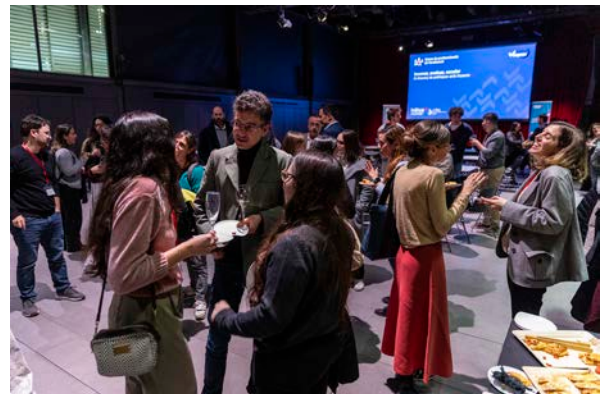
Xarxa de professionals de l'avaluació