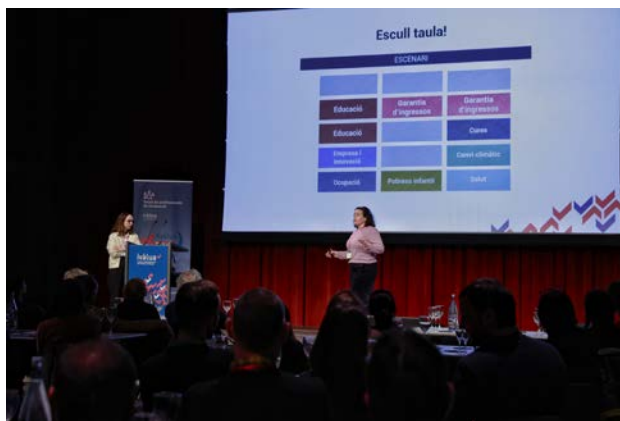
Dinàmica de les persones assistents