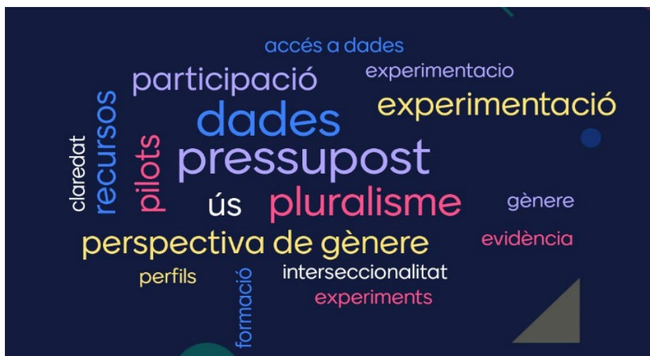
Núvol de conceptes elaborat entre totes les persones assistents a l'acte

La jornada va concloure amb la participació de tots els assistents en l'elaboració d'un núvol de conceptes al voltant de la legislació en avaluació responnent a la següent pregunta: “Què creus que s'hauria d'incloure en una llei catalana d'avaluació?”. Aquí les respostes: