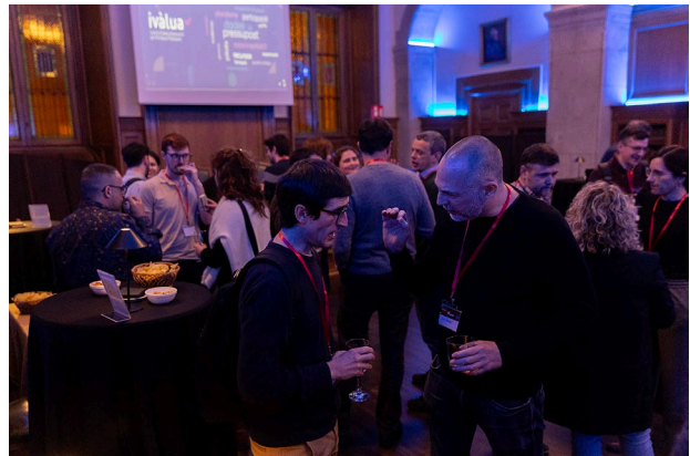
Xarxa de Professionals de l'avaluació

ivàlua ✓ Institut Català d'Avaluació de Polítiques Públiques