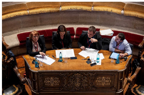
Reial Acadèmia de Medicina de Catalunya