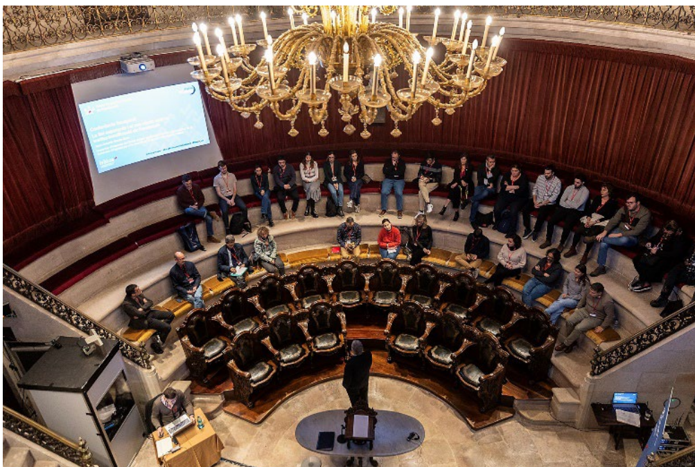
Reial Acadèmia de Medicina de Catalunya