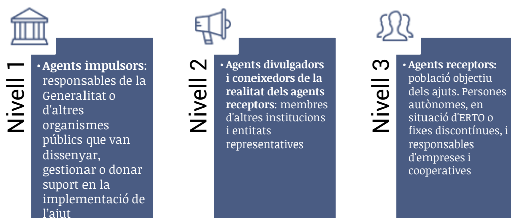
Figura 1: Classificació d'agents informants per nivells

Finalment, en el nivell 3 s'inclou la població objectiu dels ajuts , és a dir, totes aquelles persones físiques i jurídiques que podien optar a algun dels ajuts analitzats en l'estudi. Aquesta categoria inclou persones que van estar en un ERTO o van tenir un contracte fix discontinu, persones autònomes, cooperativistes i responsables d'empreses .